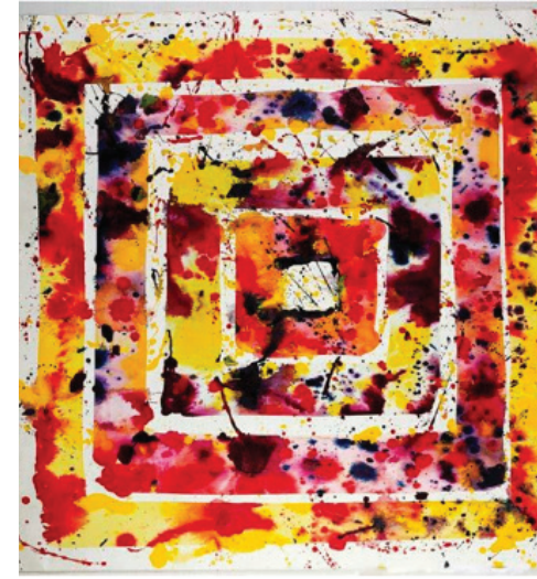
Resim 5: Francis, Samuel Lewis: Untitled Mandala, tuval üzeri akrilik, 93 cm x 94 cm, 1975.

Mandalanın gerek geçmişte gerek günümüzde kullanılan halinin, Hindu ve Budist mistisizmi ile doğrudan ilişkili olduğu gözleminden hareketle, Sam Francis'in Tantrik Budizm'den esinlendiği kanısı oluşmaktadır. Tantrik mandalalar, gerek mikro gerek makro yapılarıdaki tüm ayrımların kaybolarak Budalığın mükemmel ifadesi olarak tezahür etmektedir. Sam Francis'in Untitled Mandala adlı eserinde, renk çeşitliliği ile bu yapıların farklılıklarını vurguladığı; iç içe geçen aynı formları kullanarak ise bu yapıların özünde aynı olduğu düşüncesini aktaran yaşam döngüsünü açıklamaya çalıştığı söylenebilir.