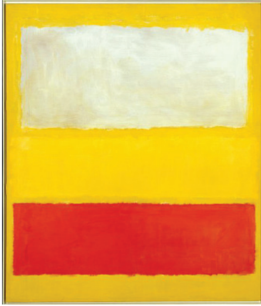
Resim 2: Rothko, Mark: No. 13. Tuval üzerine toz pigmentlerle yağlı boya ve akrilik. 242,3 x 206,7 cm, 1958. Clearwater, B. (2003).