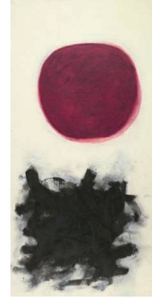
Resim 1: Gottlieb, Adolph: Blast I, tuval üzeri yağlı boya, 228,7 cm x 114,4 cm, 1957.

Burst serisi temelinde, Gottlieb'in, tuvali dikey kullanarak atmosferik bir arka plan oluştururken iki zıt öğeyi soyutlamasının, Taoizmin evrenin döngüsel kuralı olan Yin ve Yang bağlamında, aydınlık/karanlık, sıcak/soğuk, dişil/eril, açık/kapalı, gece/gündüz gibi zıtlıkları, denge ve uyum içinde yansıttığı söylenebilir.